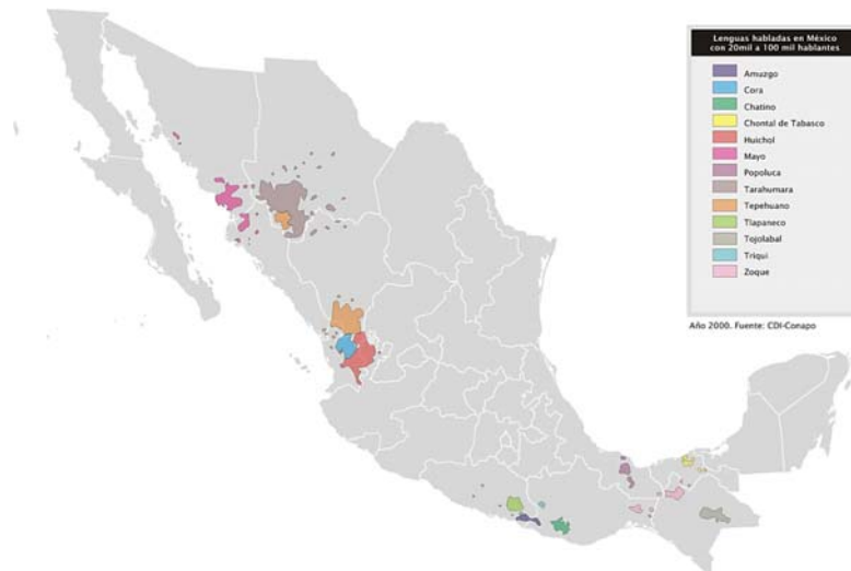
Mapa 1. Lenguas indígenas habladas en México.

http://es.wikipedia.org/wiki/Lenguas_de_M%C3%A9xico